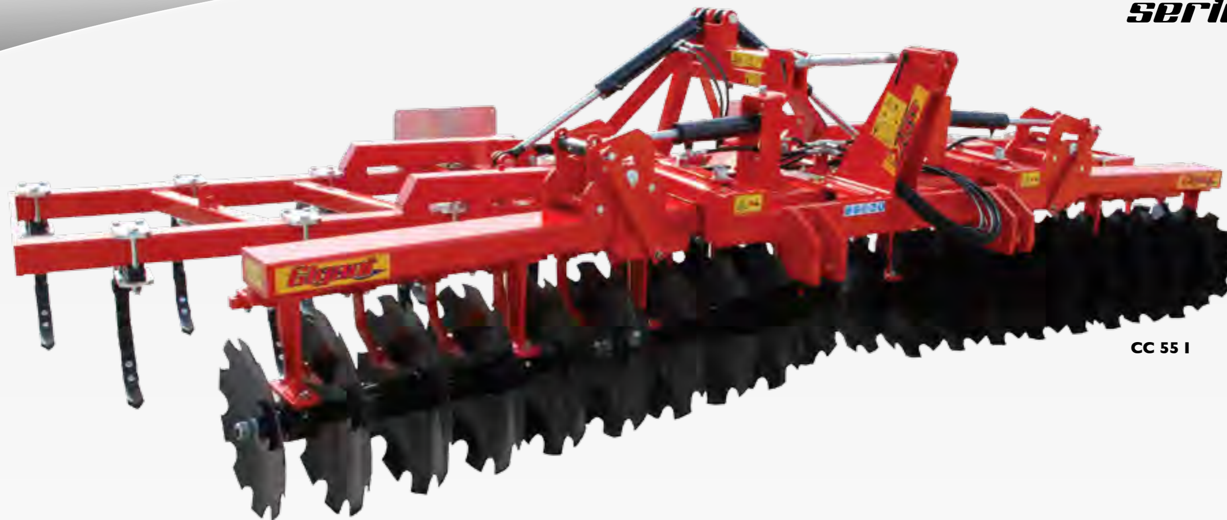
CC 55 I